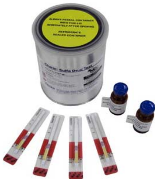
Charm Sulfa Test Kit

Rychlý širokospektrý test na stanovení sulfonamidů v mléce